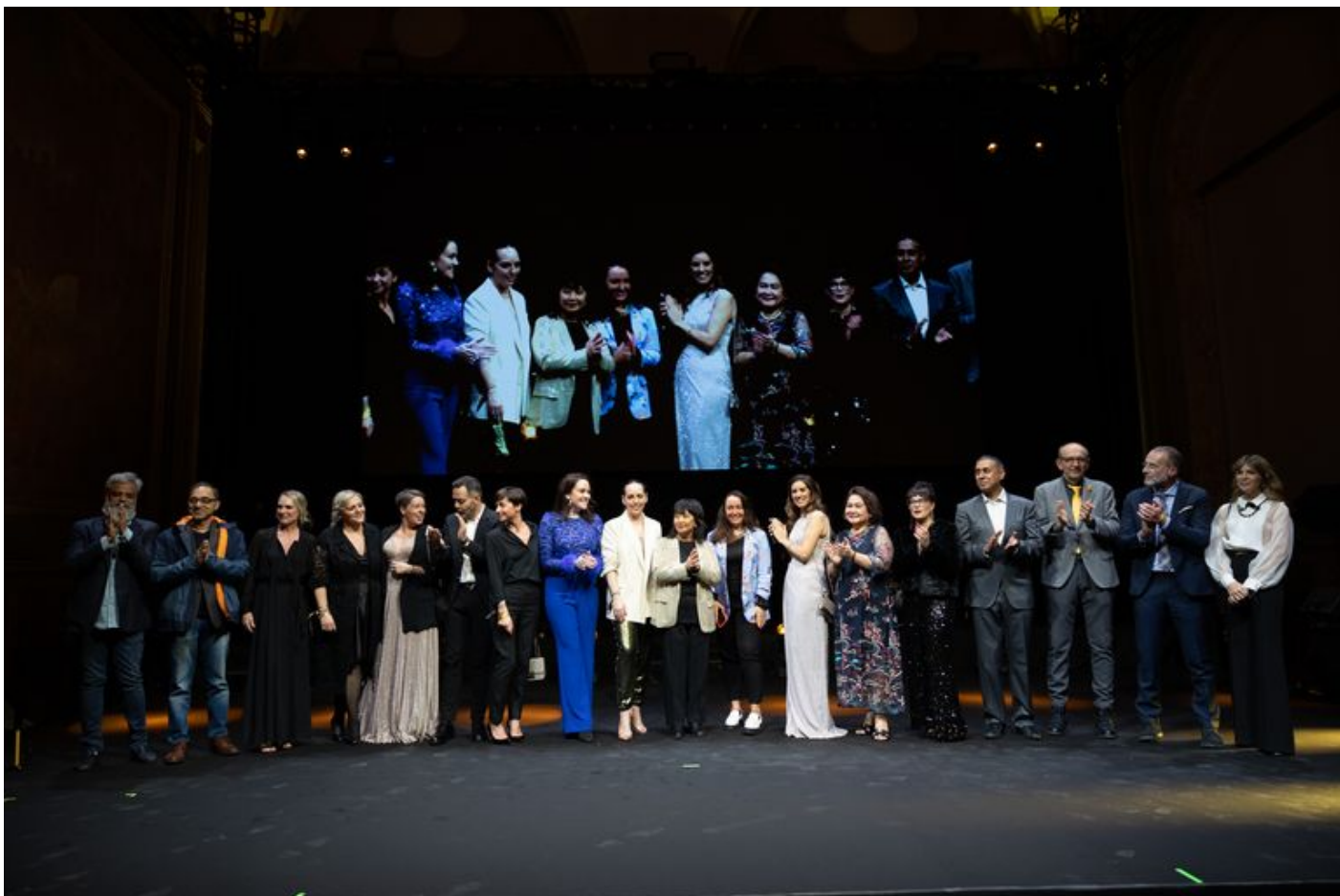
Presentazione della giuria di Cosmoprof e Cosmopack Awards