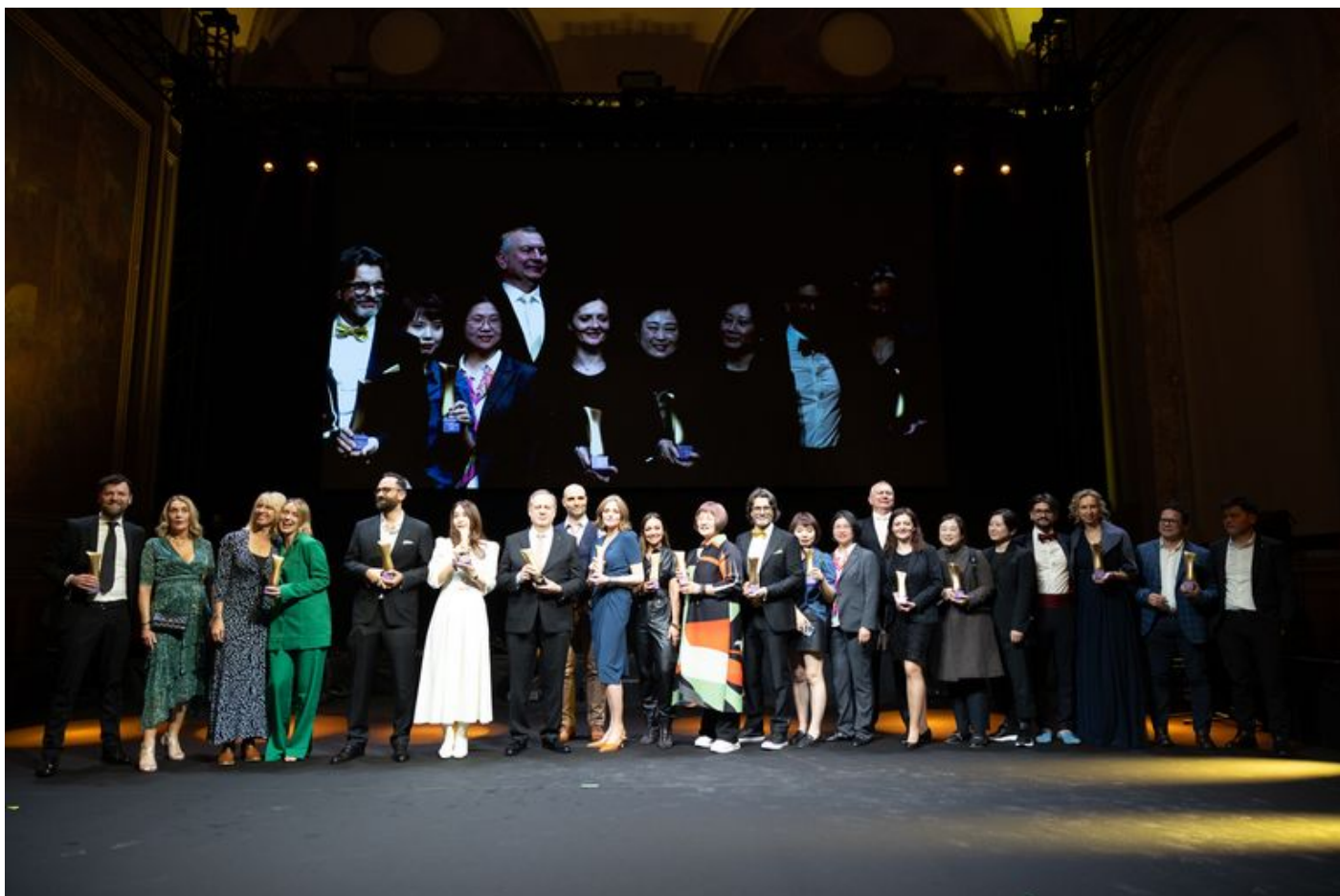
I vincitori di Cosmoprof e Cosmopack Awards chiamati sul palco durante la cerimonia di premiazione