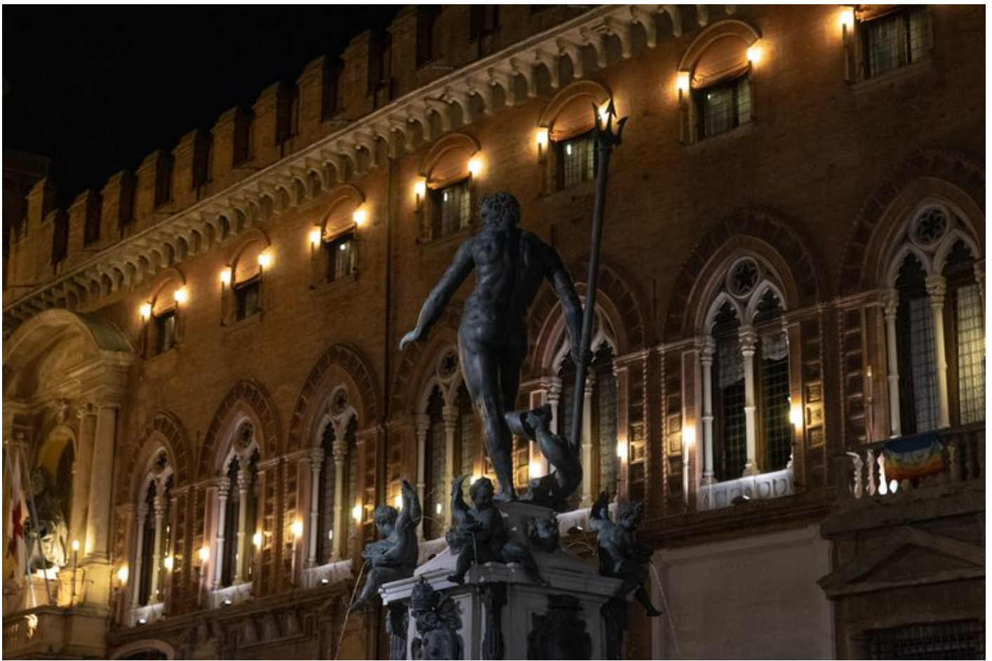
Palazzo Re Enzo, la location della cerimonia di premiazione